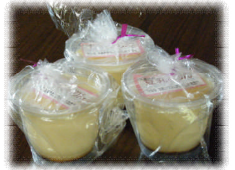
ヘルシーな豆乳プリン!