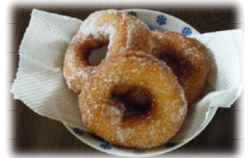
一味違うオカラドーナツ!